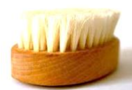
une brosse de nettoyage