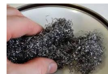
de la laine d'acier